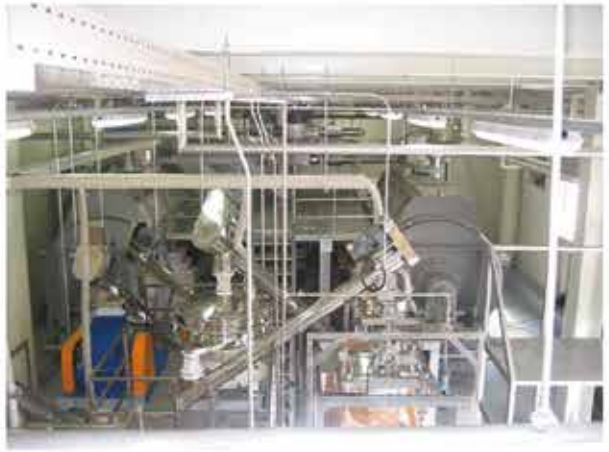
» Model : GP-60H