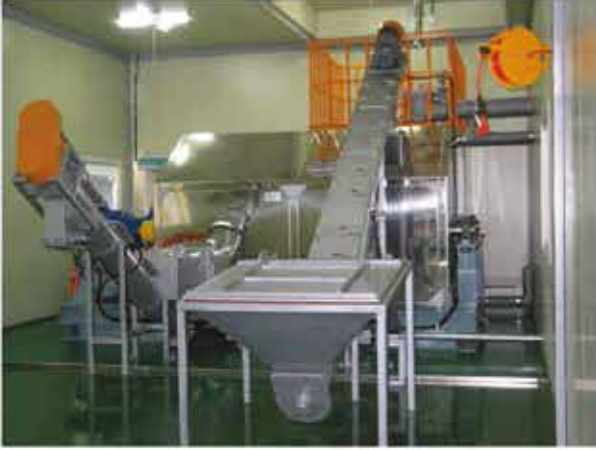
» Model : GP-3H