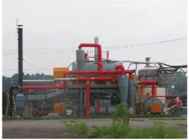
» Model : GP-12H