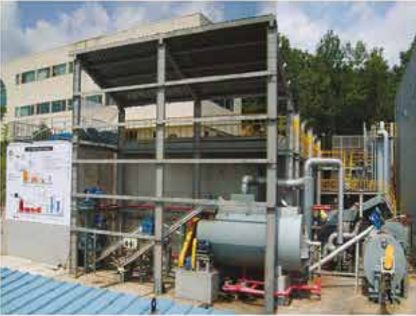
» Model : GP-24H